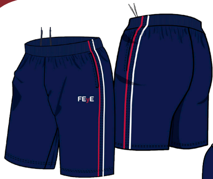
PANTALÓN CORTO CHÁNDAL